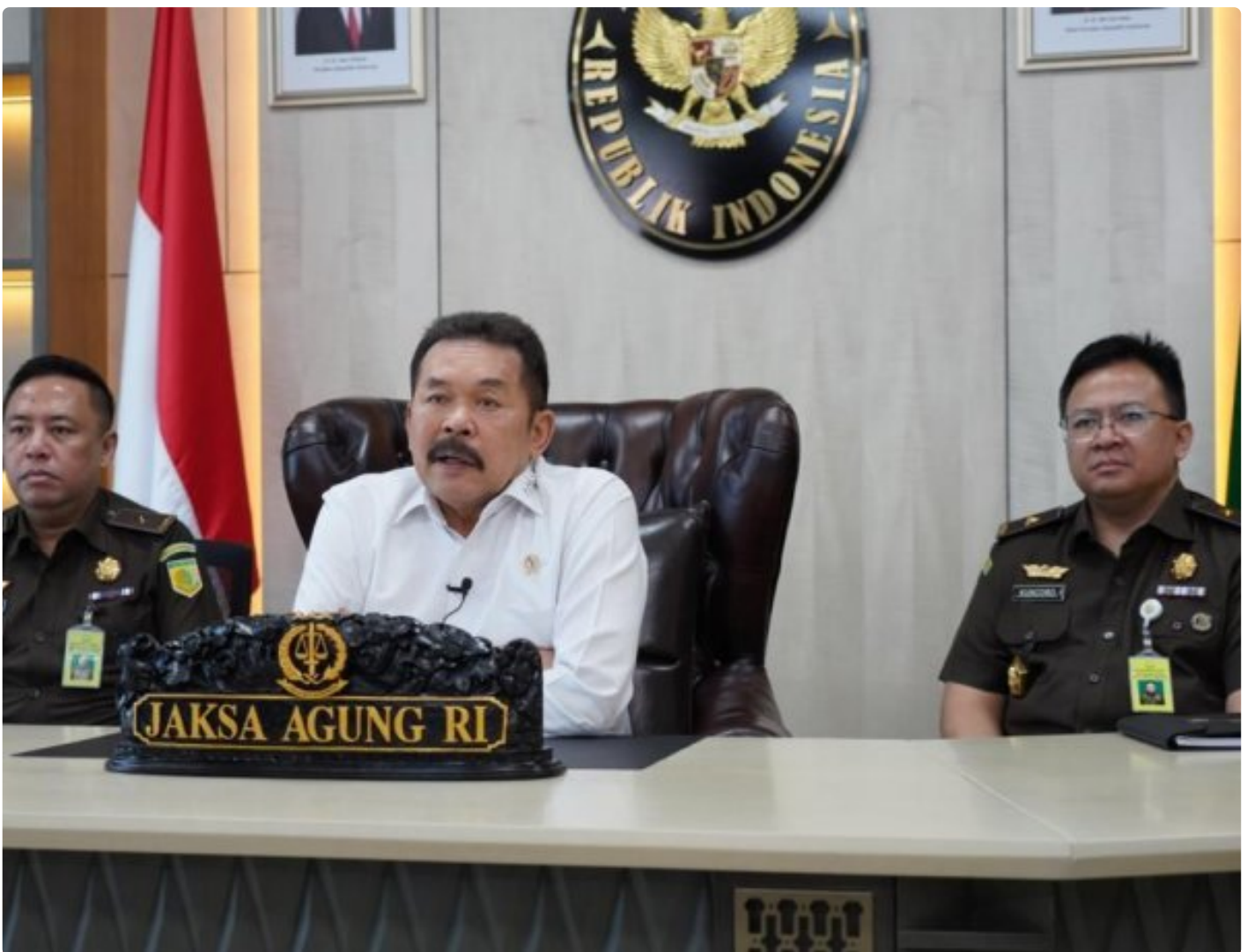
Jaksa Agung, Burhanuddin